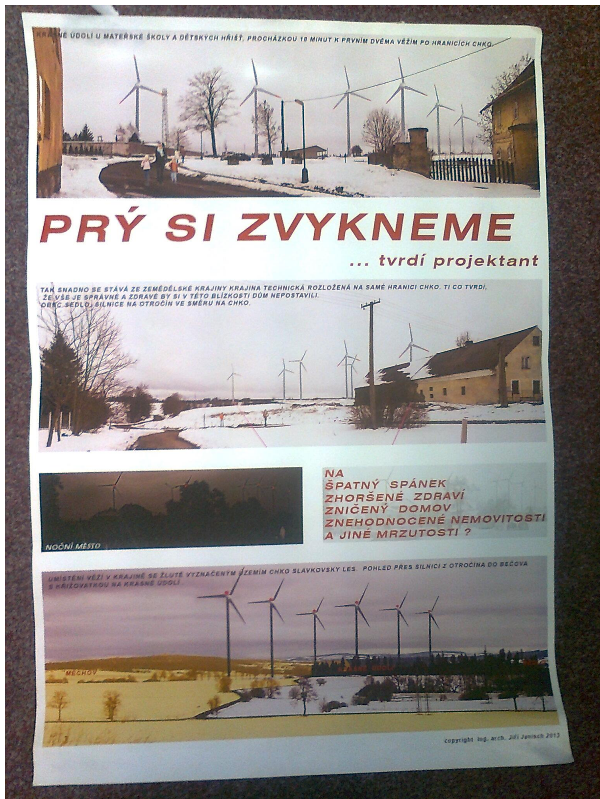
Plakát umístěný na náměstí