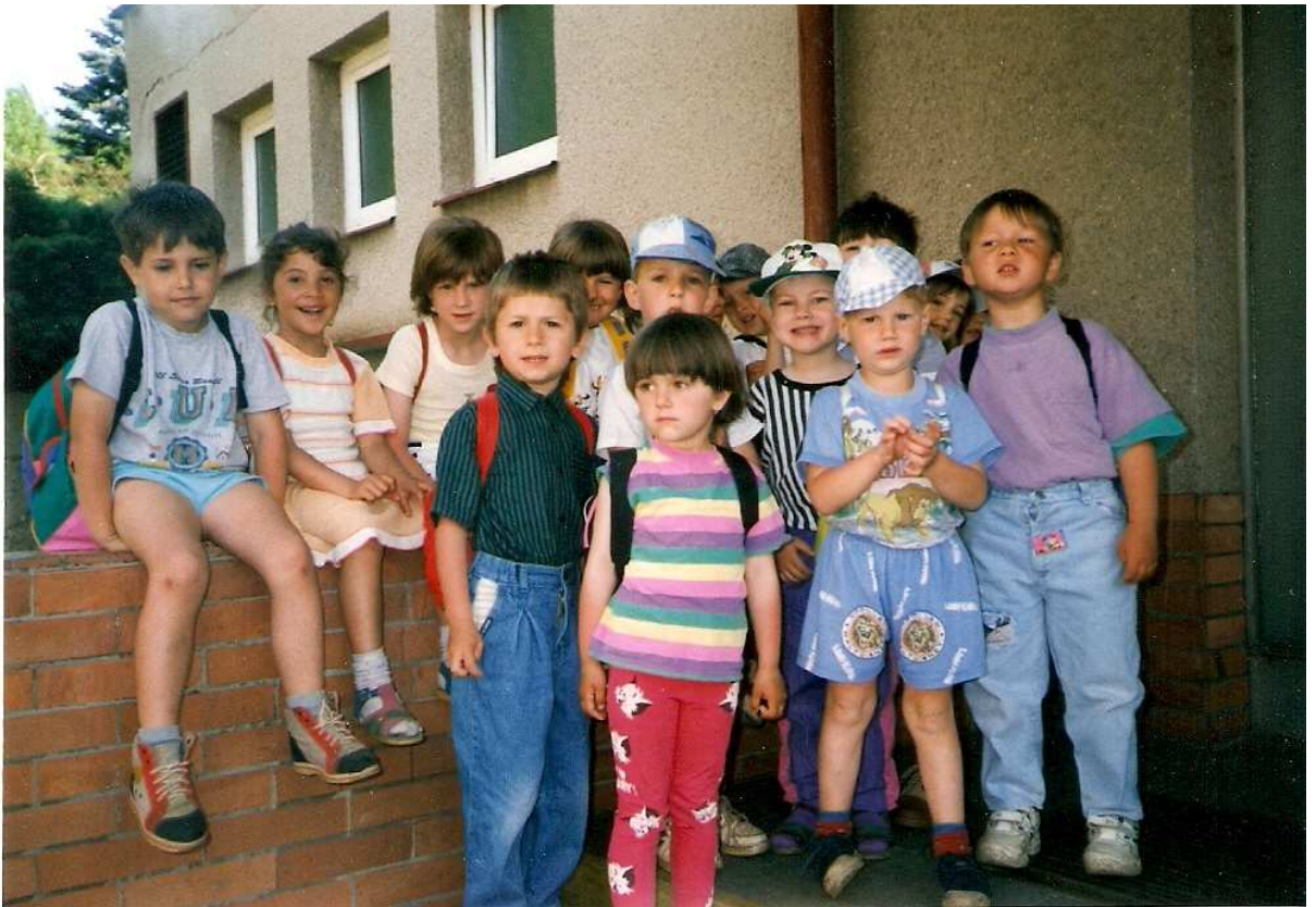
Kurz plavání ve Žluticích