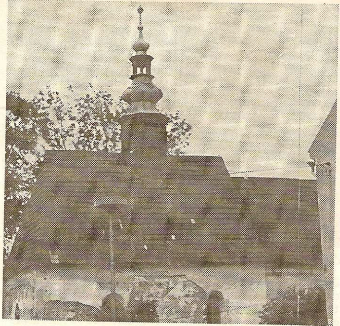
Lidé se v neděli scházejí v kostelíku sv. Vavřince

Místní služby se kromě prodejny Jednoty rozrostly ještě o jednu soukromou prodejnu a restauraci. Mimořádně toto zařízení využívají především mladí pro své diskotékové pořady. Těm „dříve narozeným“ zůstal jen zimní ples nebo letní pouť. Příležitosti k setkání je stále méně,