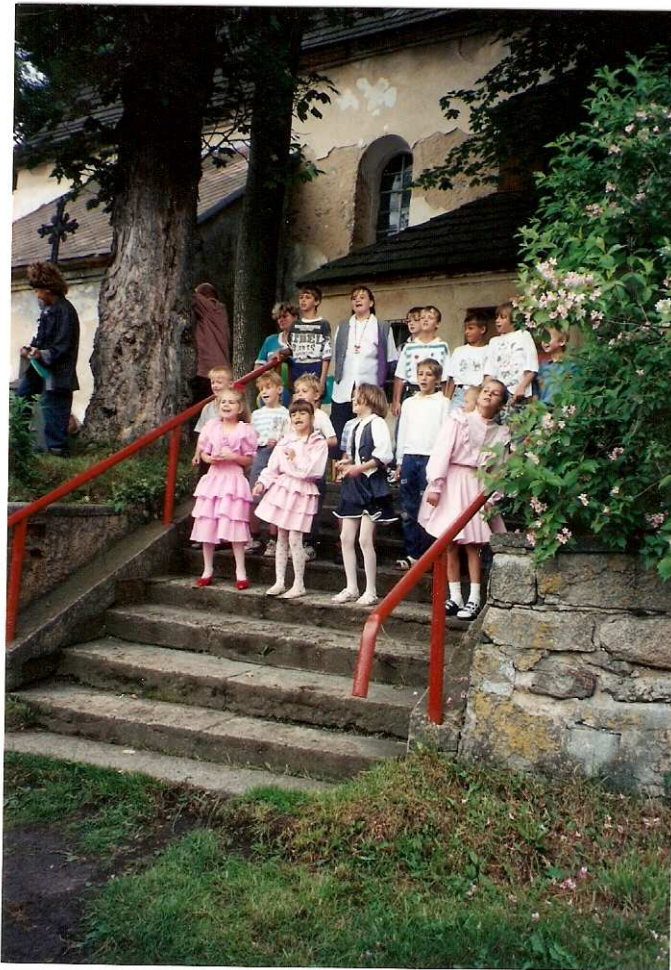
Vystoupení dětí MŠ a ZŠ na oslavách