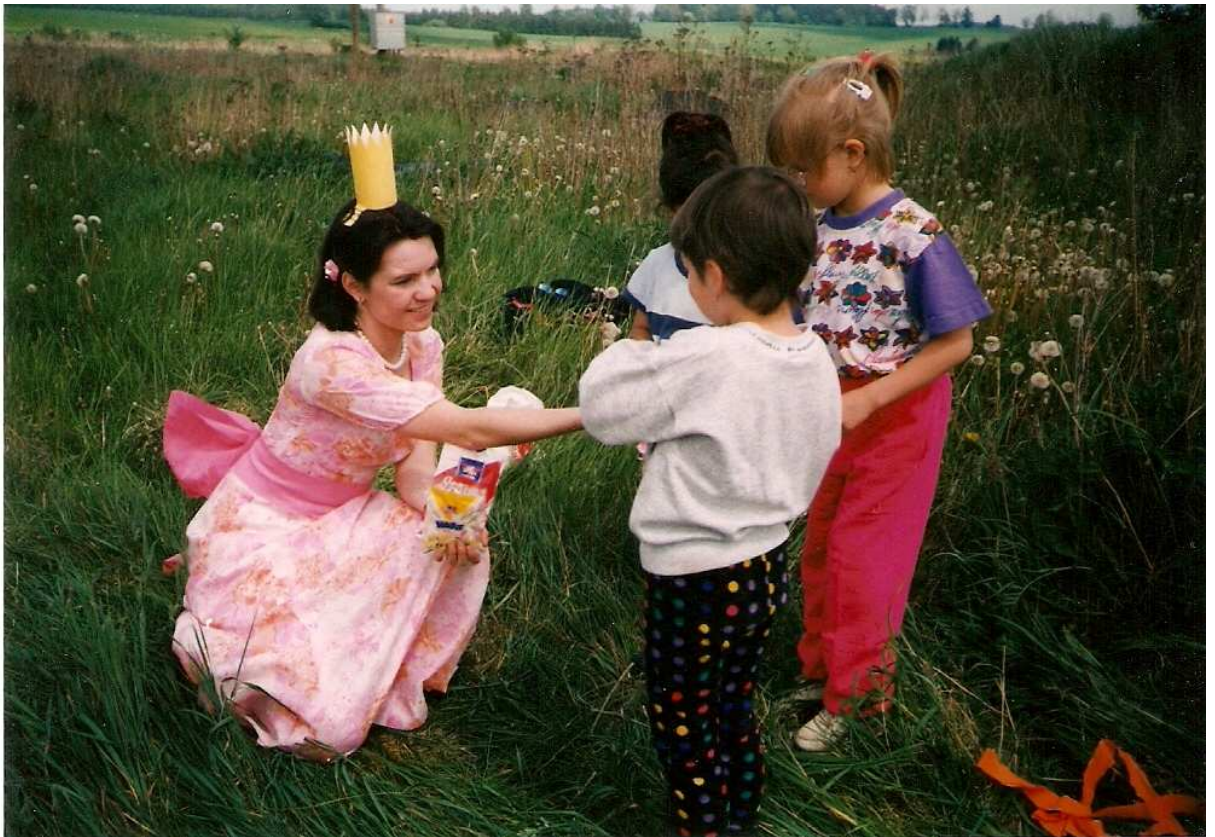
Cesta pohádkovým lesem ( červen )