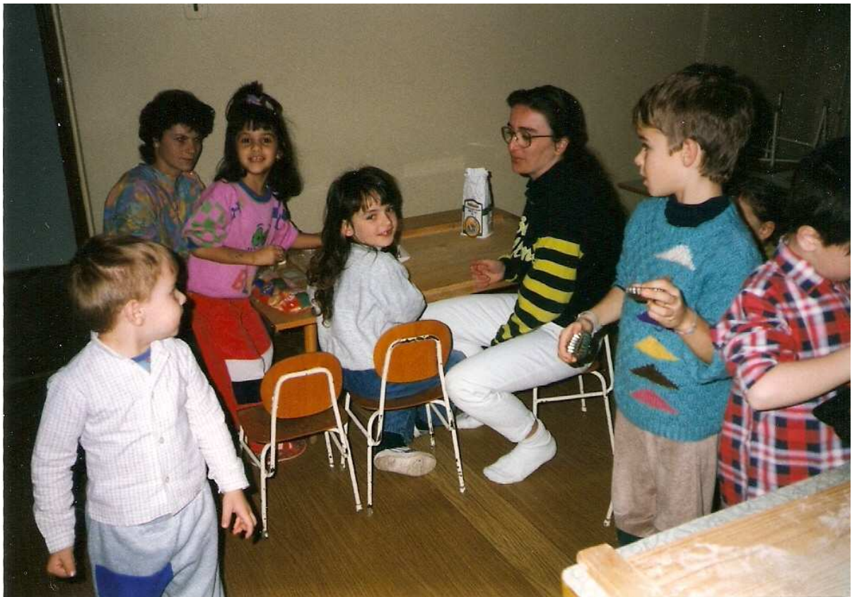
Vánoční přípravy a besídka ( 4.12. )