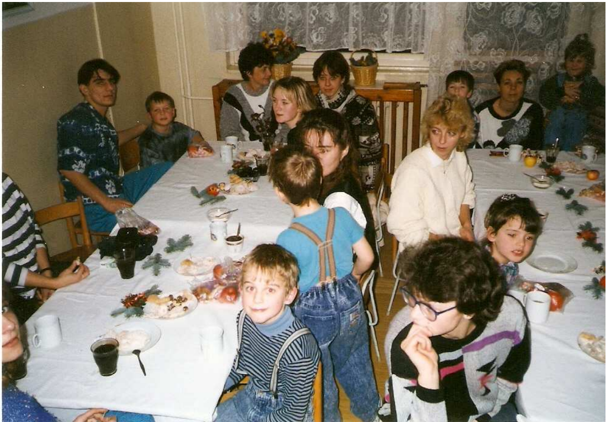
Vánoční besídka v MŠ ( 4.12. )