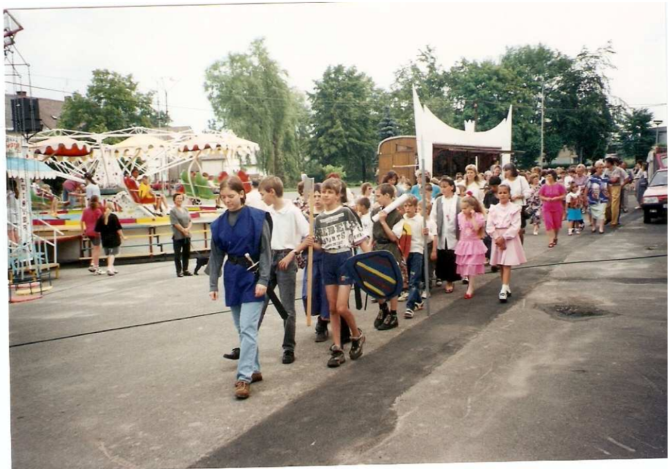
Oslavy založení obce ( 27.6. )