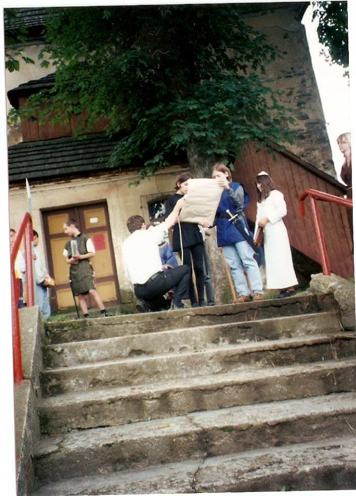
Scénka dětí o předání městských práv