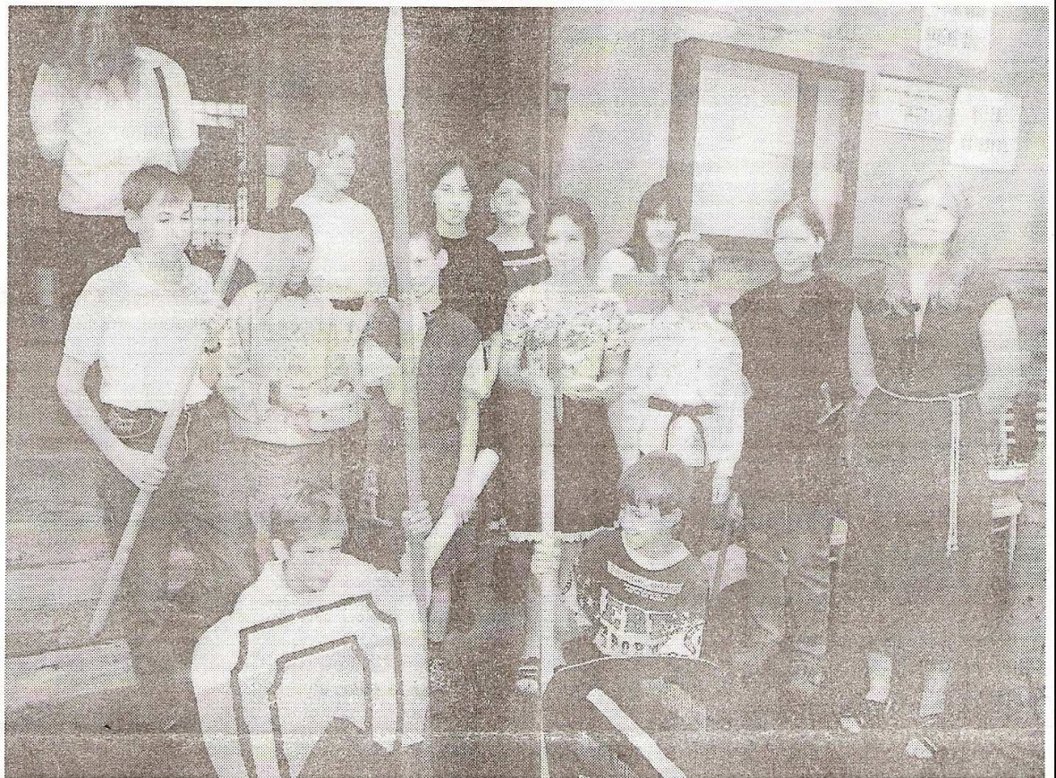
DĚTI Z HISTORICKÉHO KROUŽKU střediska volného času v Toužimi nastudovaly a zahrály scénku o předání městských práv obci Krásné Údolí.