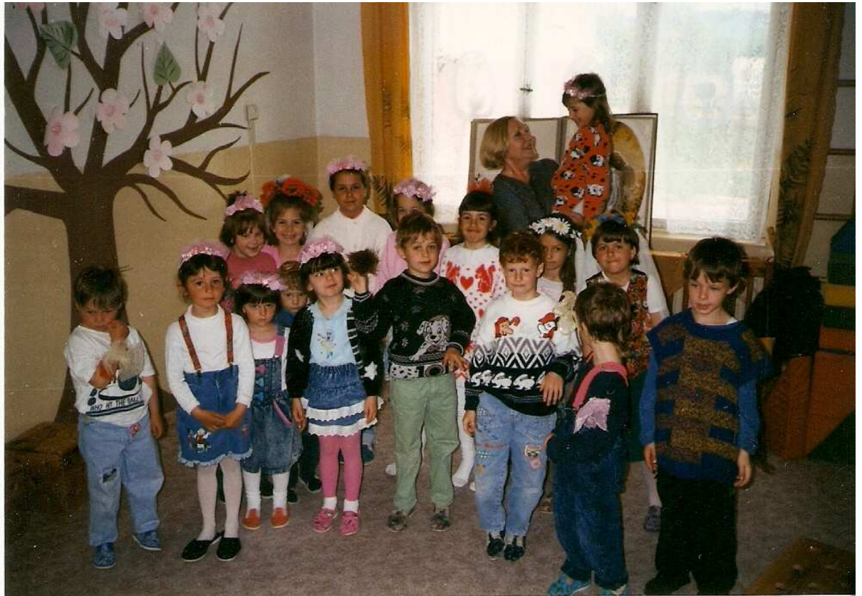
Představení Pohádka v MŠ ( květen )