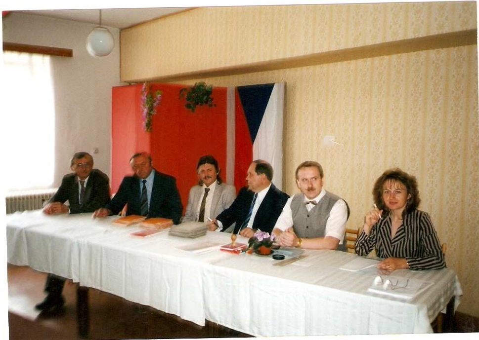
Volby do poslanecké sněmovny ČR ( 19.-20.6. )