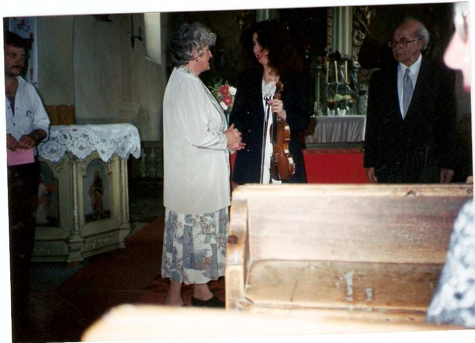
Koncert v kostele