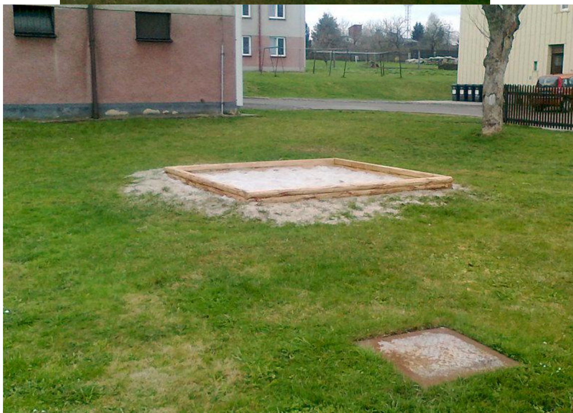
Rekonstrukce pískoviště u starých bytových domů