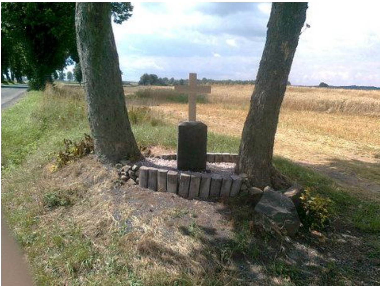
Pomníček po úpravě