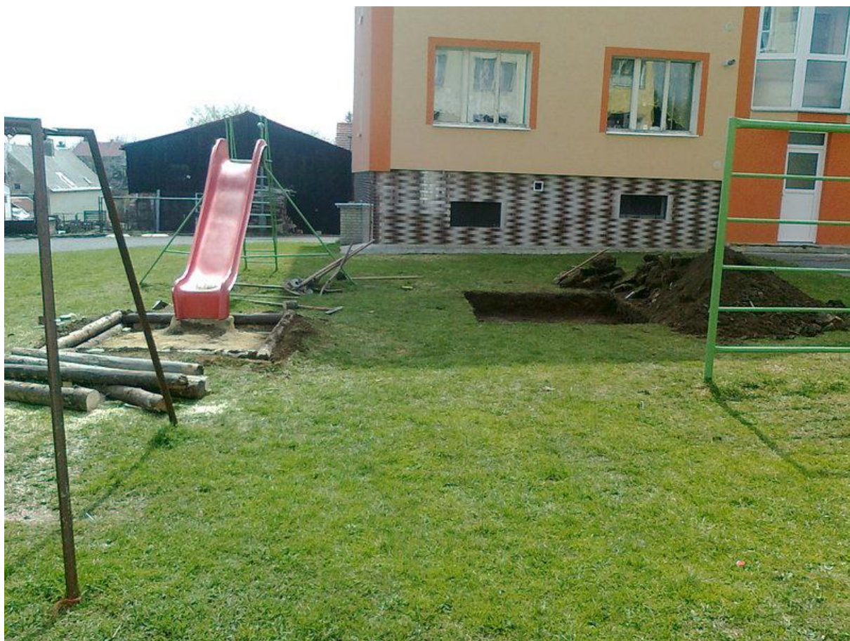
Rekonstrukce dojezdu skluzavky a nové pískoviště – Nové paneláky