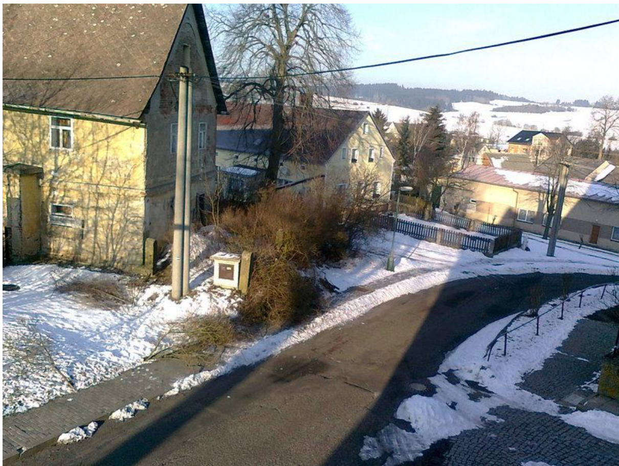
Vyřezání křovin u bývalé fary