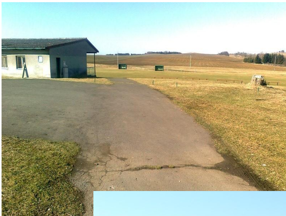
Nový plot u fotbalového hřiště (duben)