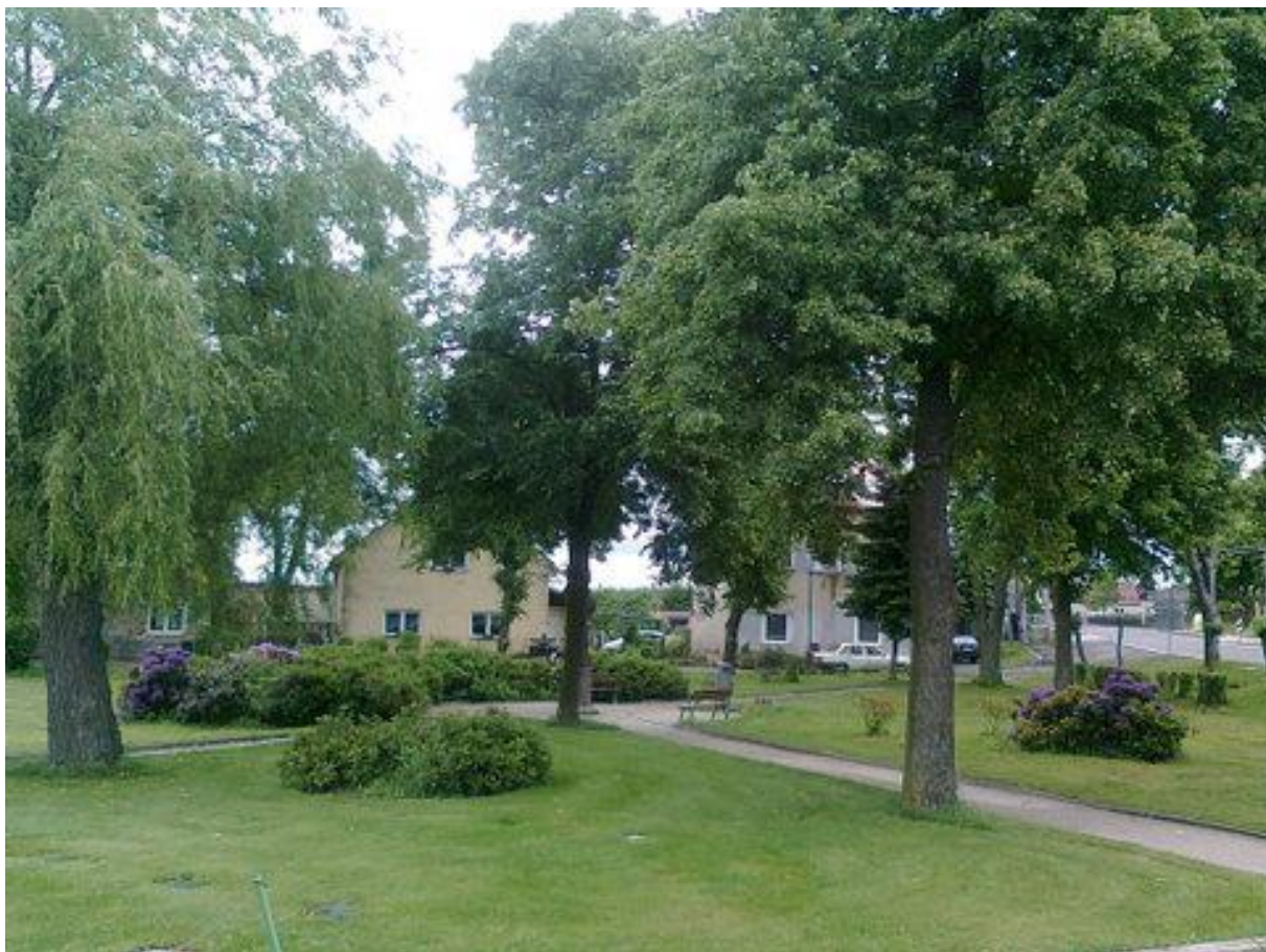
Upravený park na náměstí na jaře a v létě