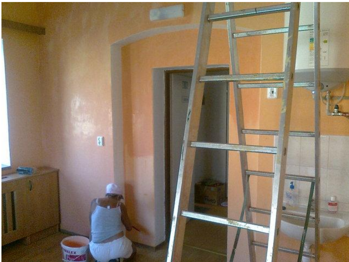
Malování v mateřské škole