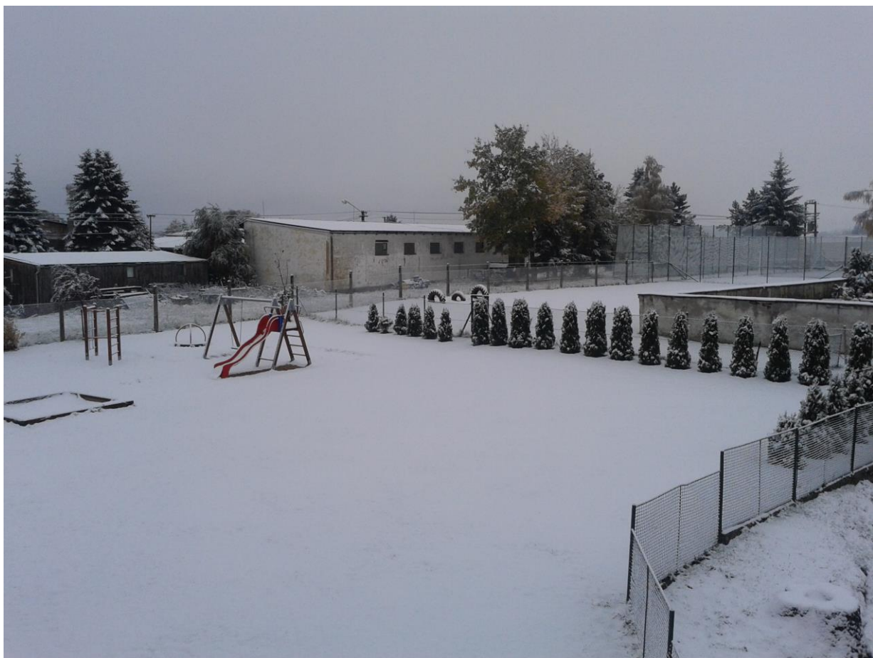
První sníh (14.10.) . . . . a také v tomto roce poslední