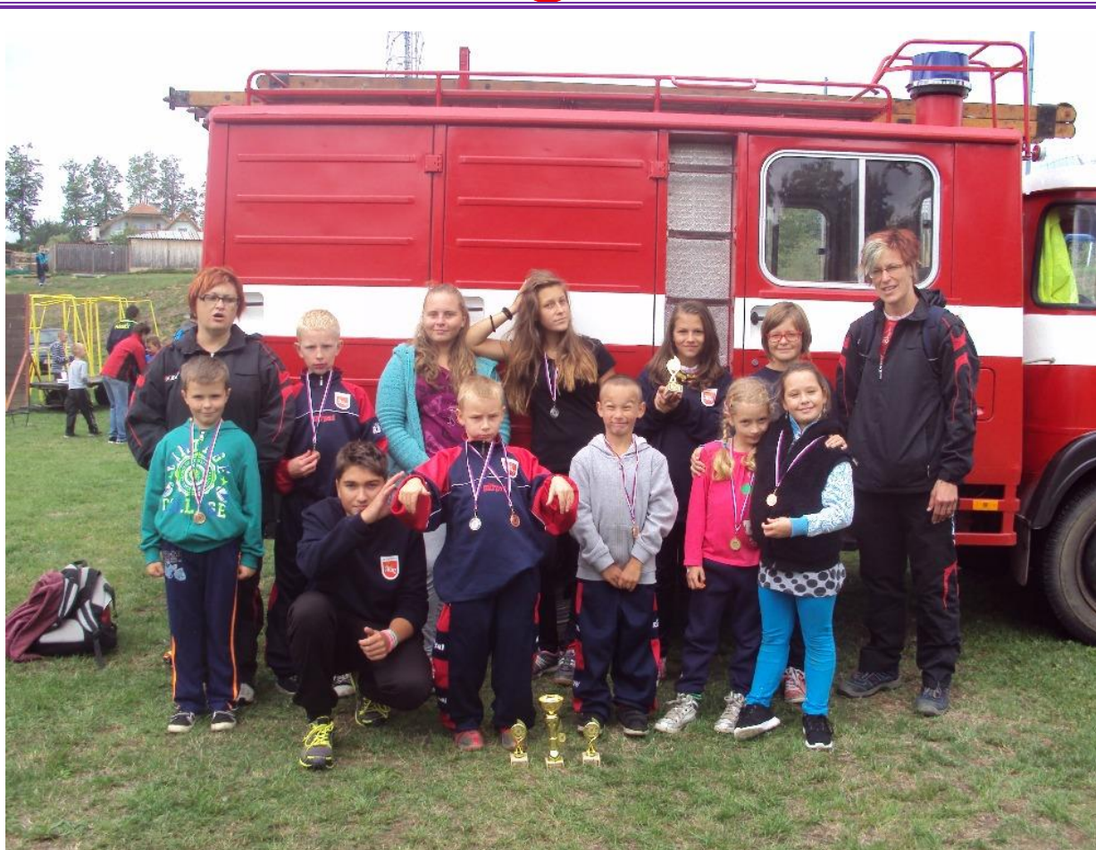
Bačův memoriál v Teplé (5.9.)