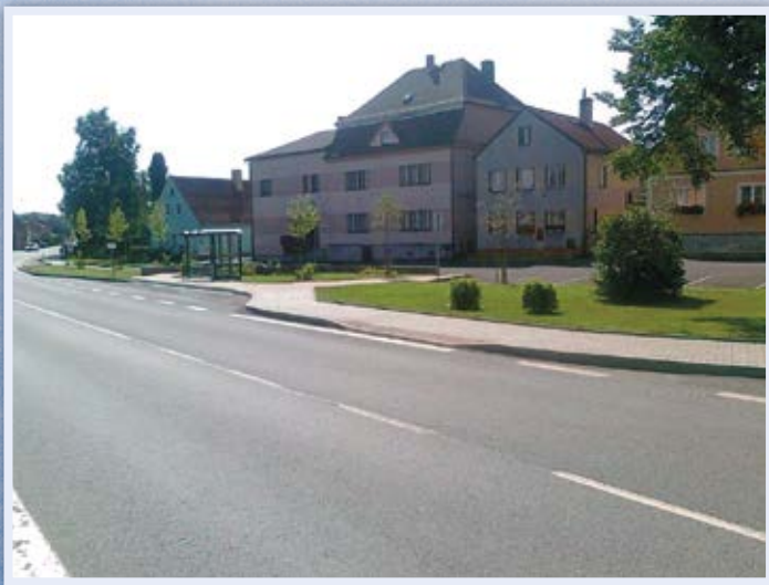
Náměstí - říjen 2014