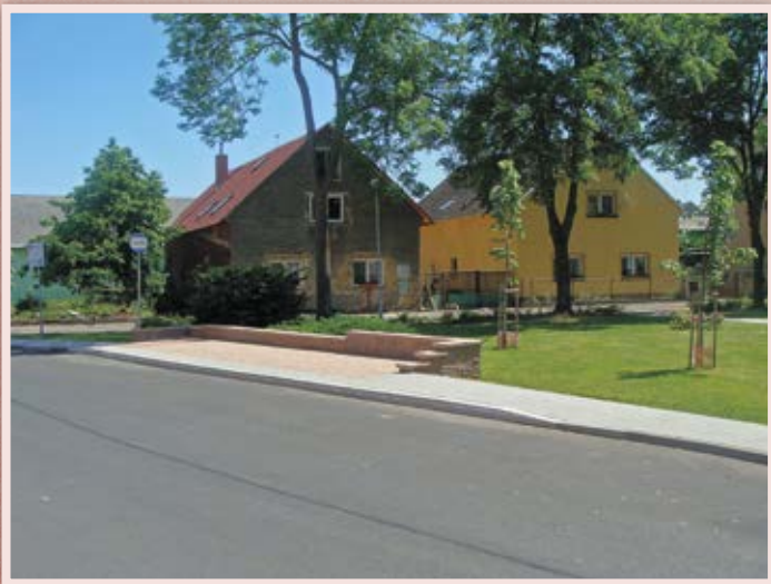
Park - červen 2015