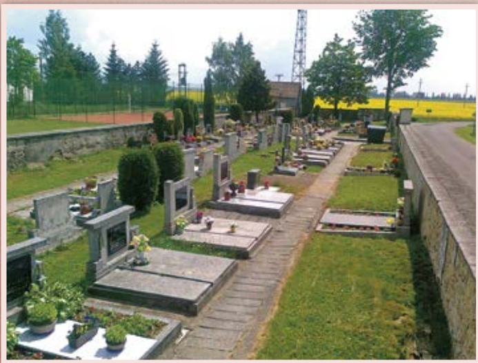
Hřbitov - květen 2012