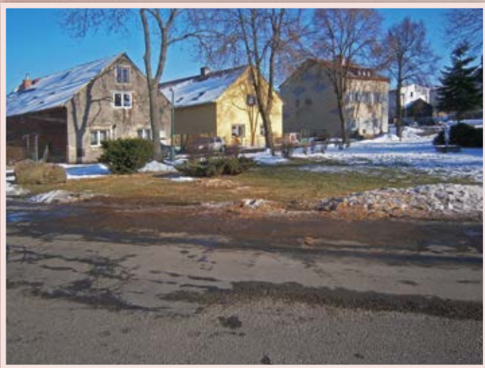
Park - březen 2013