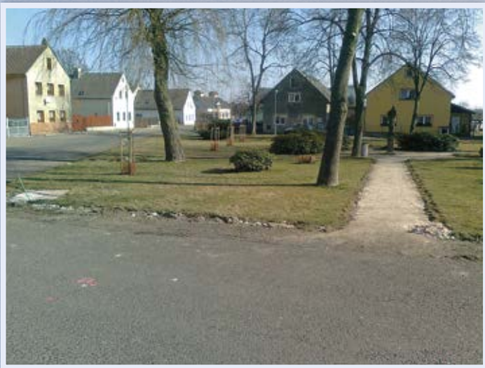
Park - březen 2014