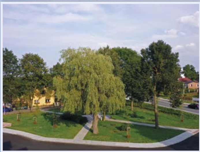
Park - červenec 2014